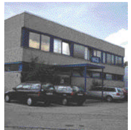
Hauptsitz von MCE in Ottobrunn bei München

Der erste Kontakt zwischen MCE und IBM Global Financing entstand Anfang des Jahres 1997 über Verantwortliche des IBM Produkthauses SSD, das die Speicherperipherieprodukte an MCE liefert. Aus intensiven Gesprächen mit IBM Global Financing entstand schließlich eine Finanzierungslösung,